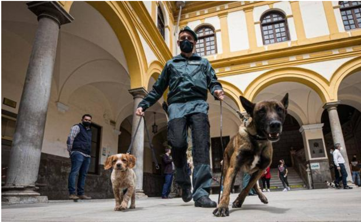
Sancho y Nivar fueron los protagonistas de la presentación del proyecto de investigación en criminología canina.

El Instituto de Criminología y la Guardia Civil desarrollan un proyecto para enseñar a los canes a obtener pruebas con su olfato